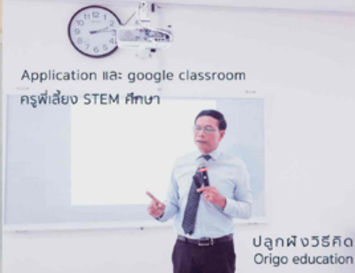
ปลุกฝังชีวิต Origo education

กระตุ้นสมองพัฒนาการ ผ่านนิทานสำหรับเด็ก อิเล็กทรอนิกส์เบื้องต้น สำหรับการทำงาน การจัดการศึกษาสำหรับนักเรียนที่มีความ ต้องการพิเศษ