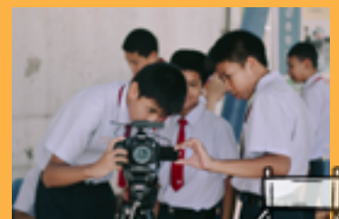
รางวัลเหรียญทองการแข่งขันภาพยนตร์สั้น ม.1-ม.3 งานศิลปหัตถกรรมนักเรียนระดับชาติ ครั้งที่ 69 จ.สมุทรปราการ