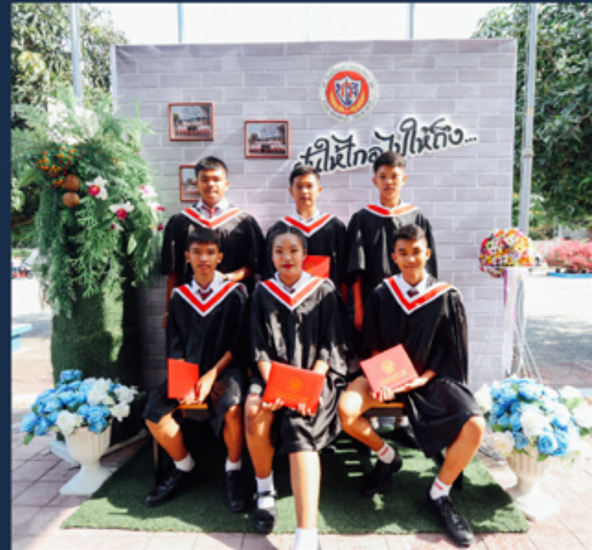
ชาวแดงแหล่งศึกษาดำเนิน