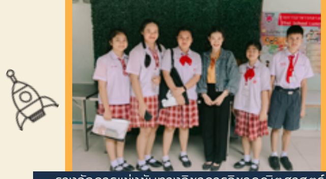
รางวัลเหรียญทองประกวดโครงงานวิทยาศาสตร์ ประเภทสิ่งประดิษฐ์ ม.1-ม.3