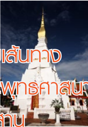
พระธาตุเชิงชุม จังหวัดสกลนคร