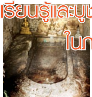
พระพุทธรูป ภูพระบาท จังหวัดอุดรธานี