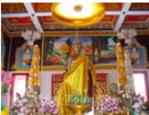
พระบาง วัดไตรภูมิ จังหวัดนครพนม

• พระบางและพระแก้ว ๒ พระปฏิมาสำคัญยิ่งของแผ่นดิน มีองค์จำลองสำคัญคือพระบาง เมืองทรายขาว วัดศรีสุทธาวาส อำเภอกำป้อเลย, พระบาง วัด ไตรภูมิ อำเภอกำป้อ นครพนม โดยที่พิพิธภัณฑสถานแห่งชาติ อุบลราชธานี ยังมีทั้งพระบาง และ พระแก้วมรกตจำลองงด งามมีอายุหลายร้อยปีอีกด้วย