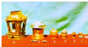
ลำดับชั้นของการบรรจุพระพุทธรูป