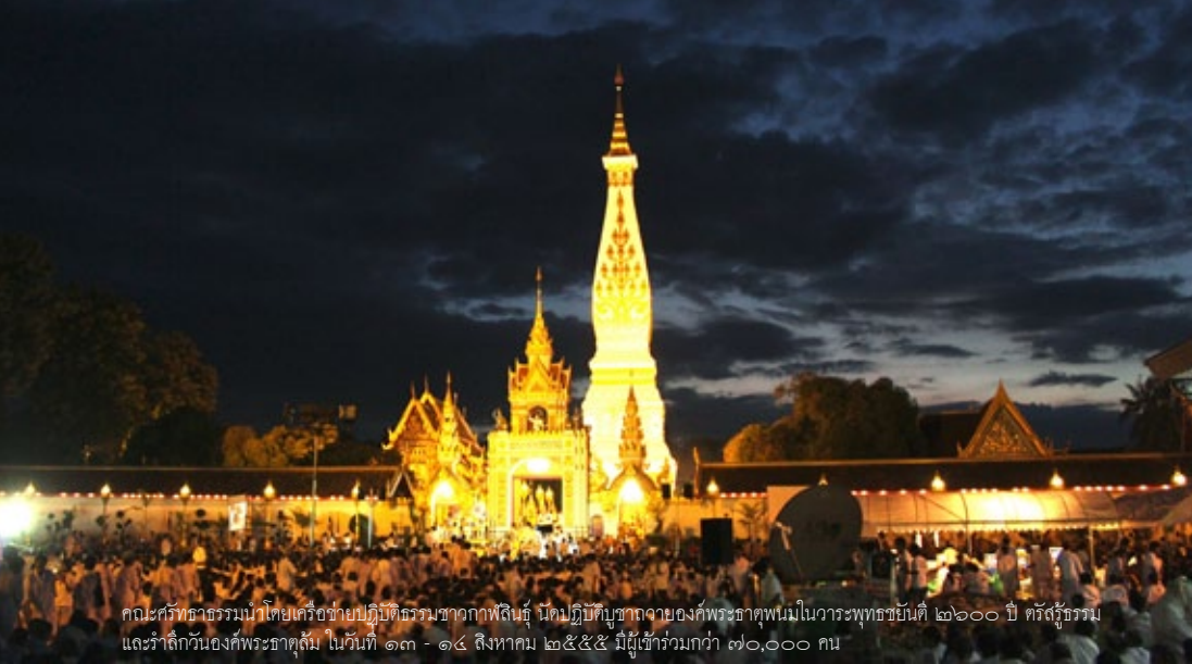
คณะภริยาธรรมนำโดยเครือข่ายปฏิบัติธรรมชาวกาฬสินธุ์ นิตปฏิบัติบูชาจากองค์พระธาตุพนมในวาระพุทธชยันตี ๒๖๐๐ ปี ศรีสวรรรม และรำลึกวันองค์พระธาตุสุ้ม ในวันที่ ๑๓ - ๑๔ สิงหาคม ๒๕๕๕ มีผู้เข้าร่วมกว่า ๗๐,๐๐๐ คน