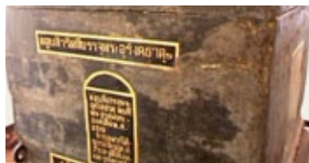
ผอบลำดับที่บรรจุพระพุทธรูป