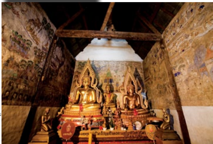
ฮุบแต่้มลิ้ม วัดโพธาราม จังหวัดมหาสารคาม