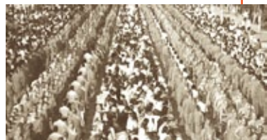
ภาพศรัทธาพุทธศาสนิกกร่วมบูชาองค์พระธาตุ

เมื่อพบ เชื่อว่าเป็นของเดิม ตั้งแต่สมัยพระมหากัสสปะ และท้าวพญาทั้ง ๕ เมื่อ พ.ศ. ๘ ซึ่งหากเป็นจริงตามตำนาน ก็น่าจะถือได้ว่าพระธาตุพนม เป็นปฐมบรมสารีริกธาตเจดีย์ ไม่เพียงที่ทางอีสานเท่านั้น แต่ของผืนแผ่นดินไทย และ อาจในเอเชียอาคเนย์ด้วย ก็ได้