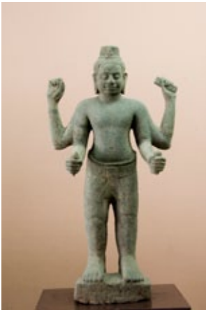
พระโพธิสัตว์อวโลกิเตศวรที่พิพิธภัณฑสถานแห่งชาติ พิมาย

• หากมีเวลาควรแวะ พิพิธภัณฑสถานแห่งชาติพิมาย และ มหาวิรุวงศ์ ซึ่งรวบรวมนันทนาหลักฐานรูปเคารพมากมาย รวมทั้งพระวัชรสัตว์พุทธะมีนาคปรกงดงามยิ่ง