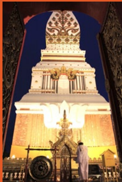
พระธาตุพนมองค์ใหม่ สร้างใหม่หลังจากที่ถล่มในรูปทรงเหมือนเดิมเมื่อ พ.ศ. ๒๕๑๙ - ๒๒ โดยกรมศิลปากร