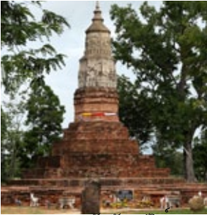
พระธาตุยาคู จังหวัดกาฬสินธุ์