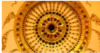
ธรรมจักรประดับด้วยสิงขรมีค่า อยู่ในพระสถูปชั้นที่ ๓