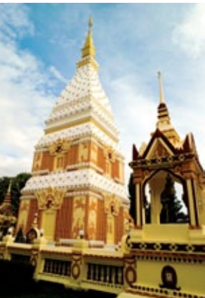
พระธาตุพนม จังหวัดนครพนม