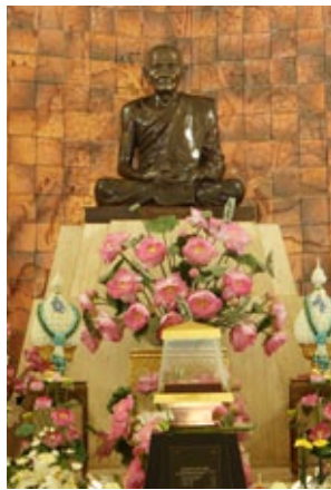
รูปปั้นพระอาจารย์มั่น ภูริทัตโต วัดป่าสุทธาวาส จังหวัดสกลนคร

กลุ่มพ่อแม่ครูบา อาจารย์ในถิ่นอีสาน แดนบูรพาจารย์ นานาสูปฏิปันโน ร่วมสมัย ปัจจุบัน ตั้งแต่ พระอาจารย์เสาร์ พระอาจารย์มั่น พระอาจารย์ชา ทั่วทั้งแดนอีสาน