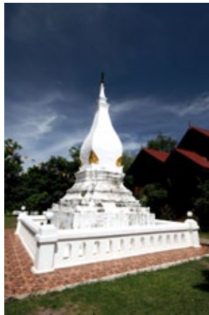
พระธาตุทรงระฆังเหลี่ยม วัดโพธิ์ชัย จังหวัดเลย

• ธาตุเจดีย์ทรงระฆังเหลี่ยม ที่วัดโพธิ์ชัย อำเภอด่านซ้าย จังหวัดเลย และวัดสาวสุวรรณ ที่เวียงคุกอำเภอเมืองหนองคาย ถือเป็นรูปแบบเอกลักษณ์หนึ่งของลาวล้านช้างที่แพร่หลายทั่วไปโดยเฉพาะในหลวงพระบาง ในขณะที่นันทนา ธาตุเจดีย์ อย่างองค์พระธาตุพนม ในนครพนมและอื่น ๆ นั้น ถือเป็นอีกแบบเอกลักษณ์ของพระธาตุพนมที่ผสมผสานด้วยนำองค์ระฆังเหลี่ยมอย่างล้านช้างมาเสริมเติมต่อบนฐานปราสาทสี่เหลี่ยม ถือเป็นอีกรอยการประสมประสานงานพระพุทธรูปศาสนาสำคัญ