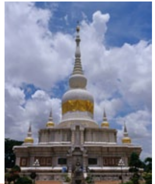
พระธาตุนาคุณ จังหวัดมหาสารคาม