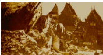
องค์พระธาตุถล่ม เมื่อปี พ.ศ. ๒๕๑๙

บุตรภริยามีศรัทธาปสาทะใน บรรพพุทธศาสนายิ่ง จึงได้นำเอา อูปพระชินชาตุเจ้าที่จันบูรระ (เวียงจันทน์) มาสถาปนาไว้ที่ ธาตูปะนมทานวิเศษเป็นเหตุ ให้ถึงสุข ๓ ประการ มีนิพพาน สุขเป็นที่แล้ว อย่าแคล้วอย่า คลา”