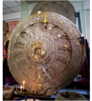
พระธรรมจักร วัดธรรมจักรเสมาราม จังหวัดนครราชสีมา

ที่สวยงามที่สุดจากพระธาตุนาคุณ แล้วตื่นตากับน่านาไบเสมา จากทั่วทั้งภาคอีสานที่นำมา รวบรวมรักษาไว้