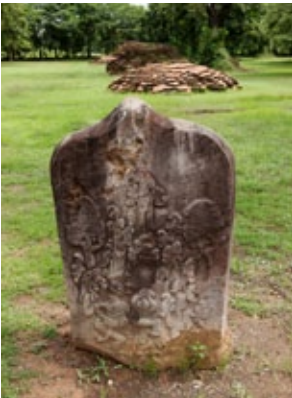
เสมาโบราณในเมืองฟ้าแดดสงยาง จังหวัดกาฬสินธุ์