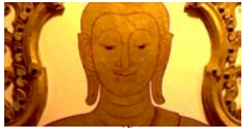
จิตรกรรมฝาผนังชั้นวิจิตร ที่ชั้นในขององค์พระธาตุพนม