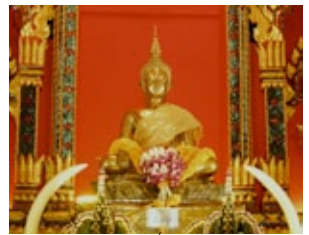
หลวงพ่อพระใส วัดโพธิ์ชัย จังหวัดหนองคาย

• พระปฏิมาล้านช้างองค์สำคัญ ในจังหวัดหนองคาย นอกจากหลวงพ่อพระใส ที่วัดโพธิ์ชัย อำเภอเมืองแล้ว ที่งดงามและศักดิ์สิทธิ์เป็นที่