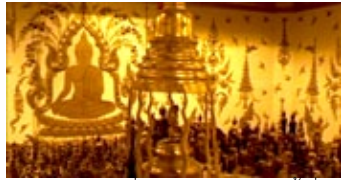
นानาพระพุทธรูปและสิงขร อยู่ในพระสถูปชั้นที่ ๒