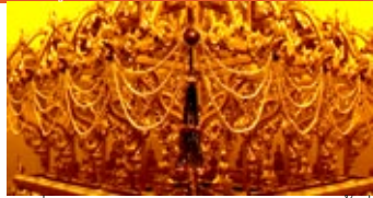
มณฑปที่บรรจุพระบรมสารีริกธาตุ อยู่ในพระสถูปชั้นที่ ๔

พลาหกไว้เป็นปริศนา ซึ่งก่อนองค์พระธาตุพนมล้มเมื่อปี พ.ศ. ๒๕๑๘ นั้น ตำนานพระอุรังคธาตุที่กล่าวถึงการประดิษฐานพระบรมสารีริกธาตุไว้ในอุโมงค์ไม่ค่อยได้รับความเชื่อถือว่าจะเป็นจริงและมีจริง จนกระทั่งวันที่ ๑๗ - ๑๘ ตุลาคม พ.ศ. ๒๕๑๘ ขณะทำการสำรวจองค์พระธาตุที่ล้มแล้วนั้น ได้พบพอบสาริดน้ำหนักรวม ๑,๒๐๐ กิโลกรัม ที่เคยอยู่ในองค์พระธาตุที่ระดับสูงจากพื้นดินประมาณ ๑๔.๗๐ เมตร มีจารึกแผ่นทองระบุ "ศักราช ๖๐ ตัว (๒๒๔๑) เดือน ๓ ขึ้น ๒ ค่ำ วันศุกร์ พ่อพระออกขนานโคตรพร้อมทั้ง