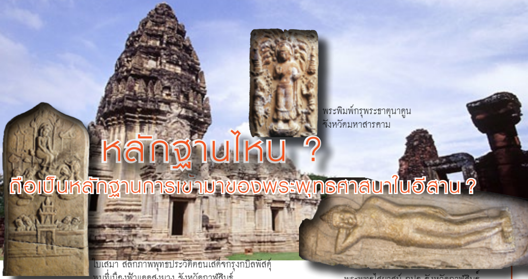
พระพิมพ์พุทธธาตุนาถุน จังหวัดมหาสารคาม