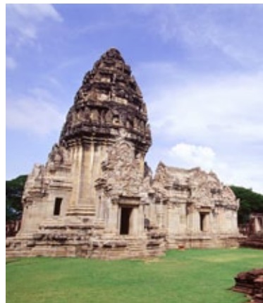
อุทยานประวัติศาสตร์พิมาย จังหวัดนครราชสีมา