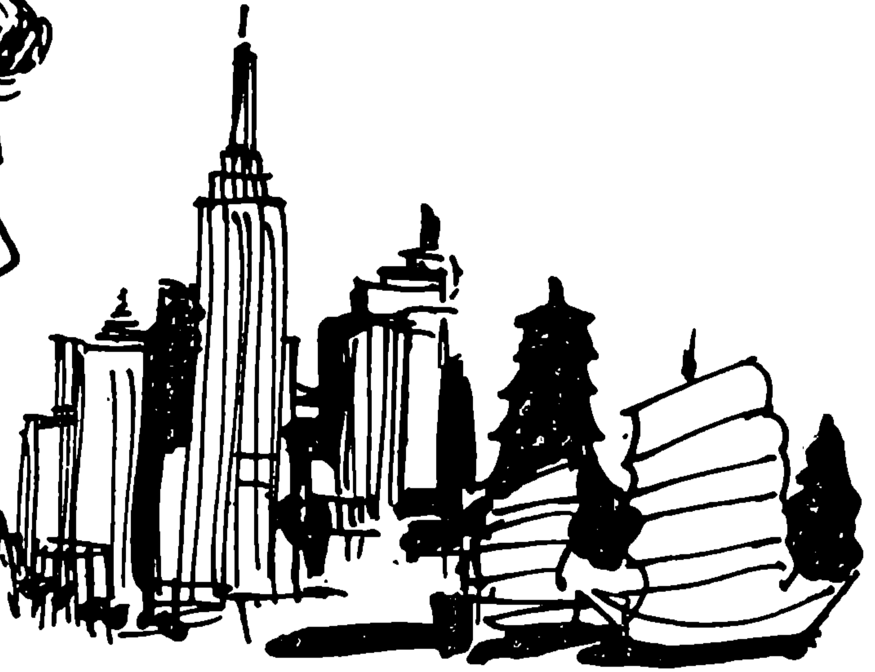
อย่างเคียวก็ไม่ได้