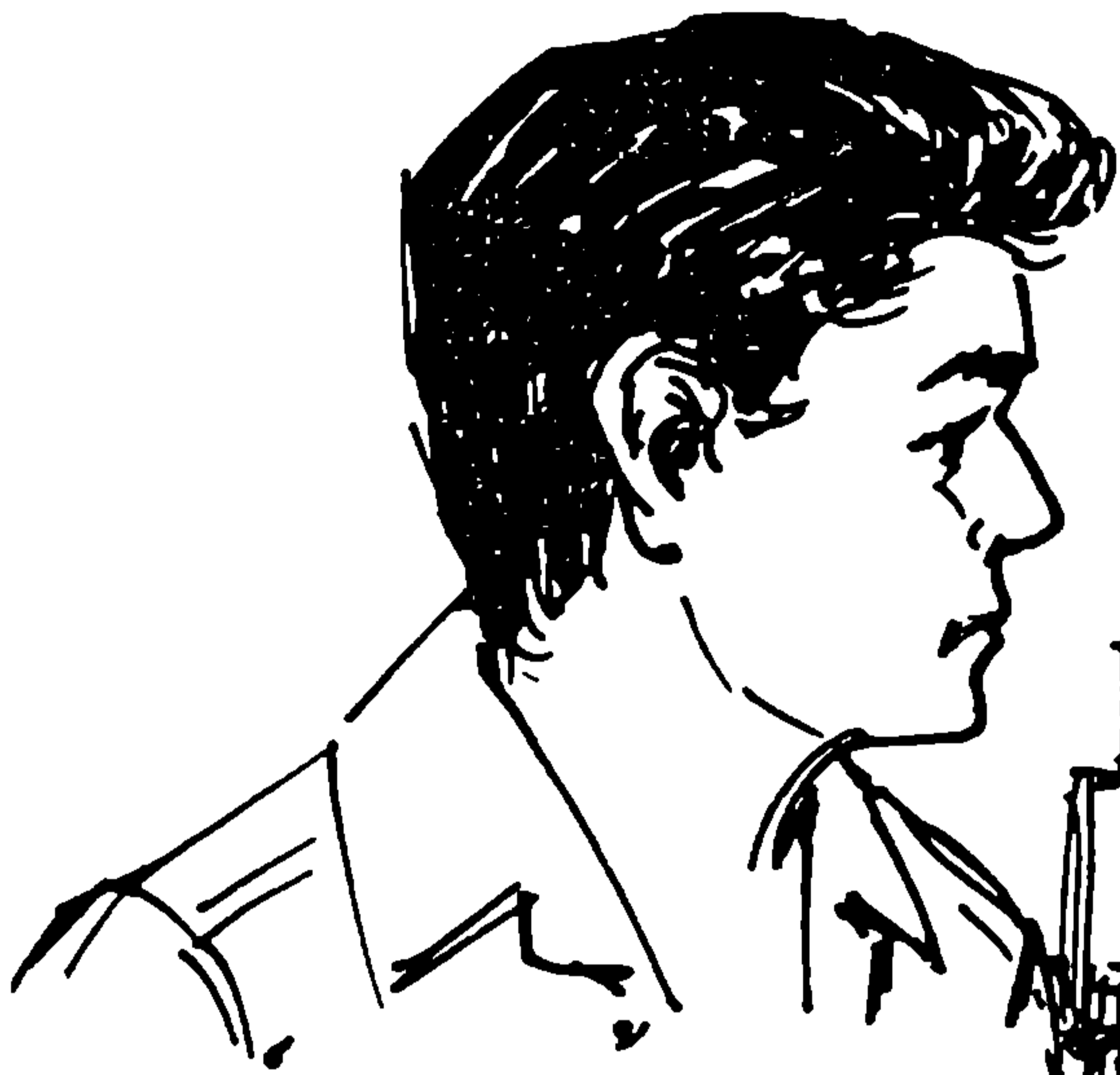
มนุษย์จะบำรุงกวยอาหาร