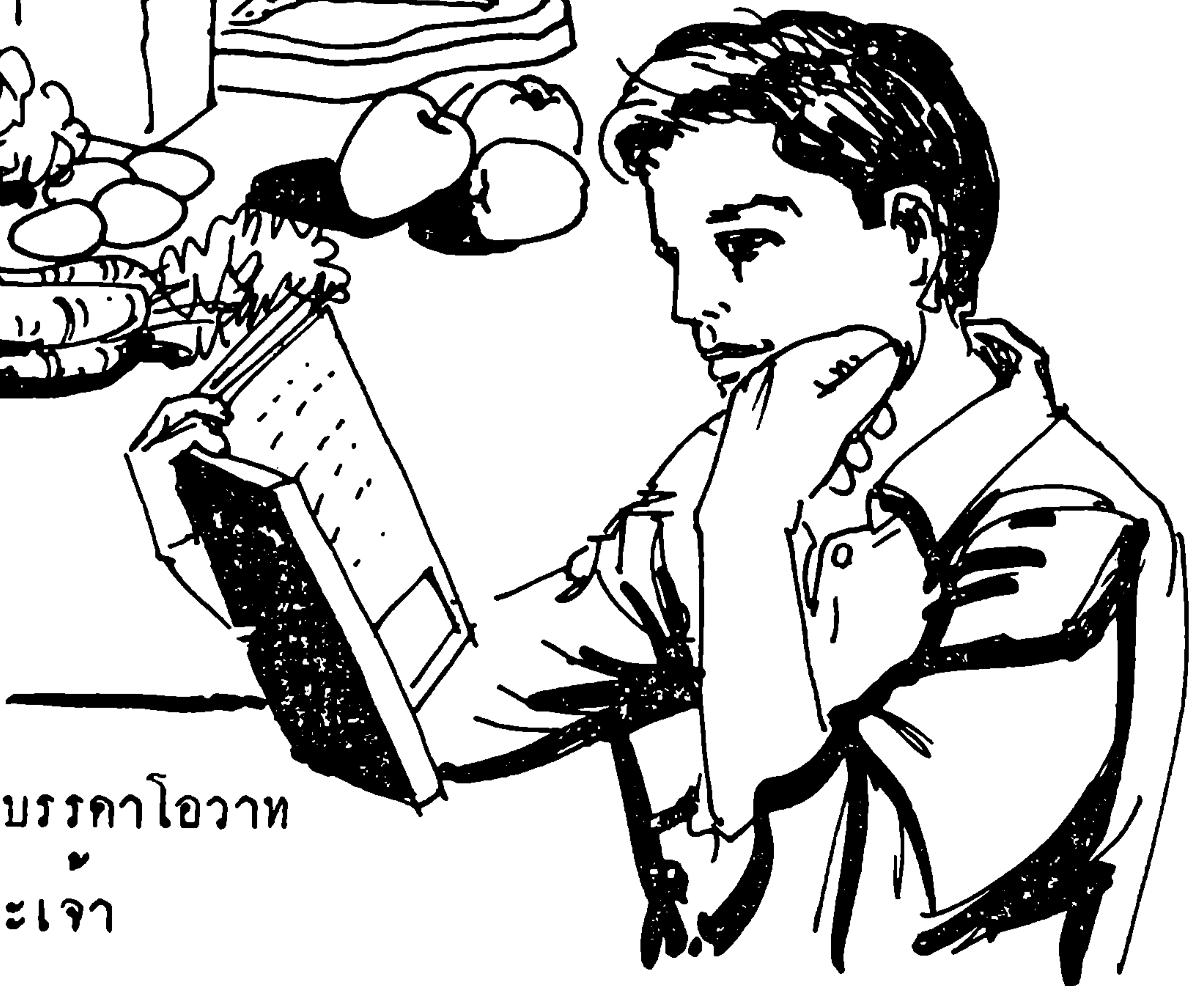
แต่กวยบรรคาคาโหวาท ของพระเจ้า